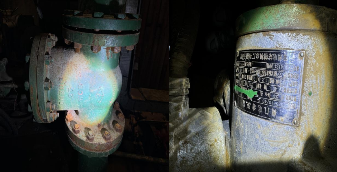
1. 凝结水泵 A、B 进口电动门 ZB30-18/40 Z 2 只