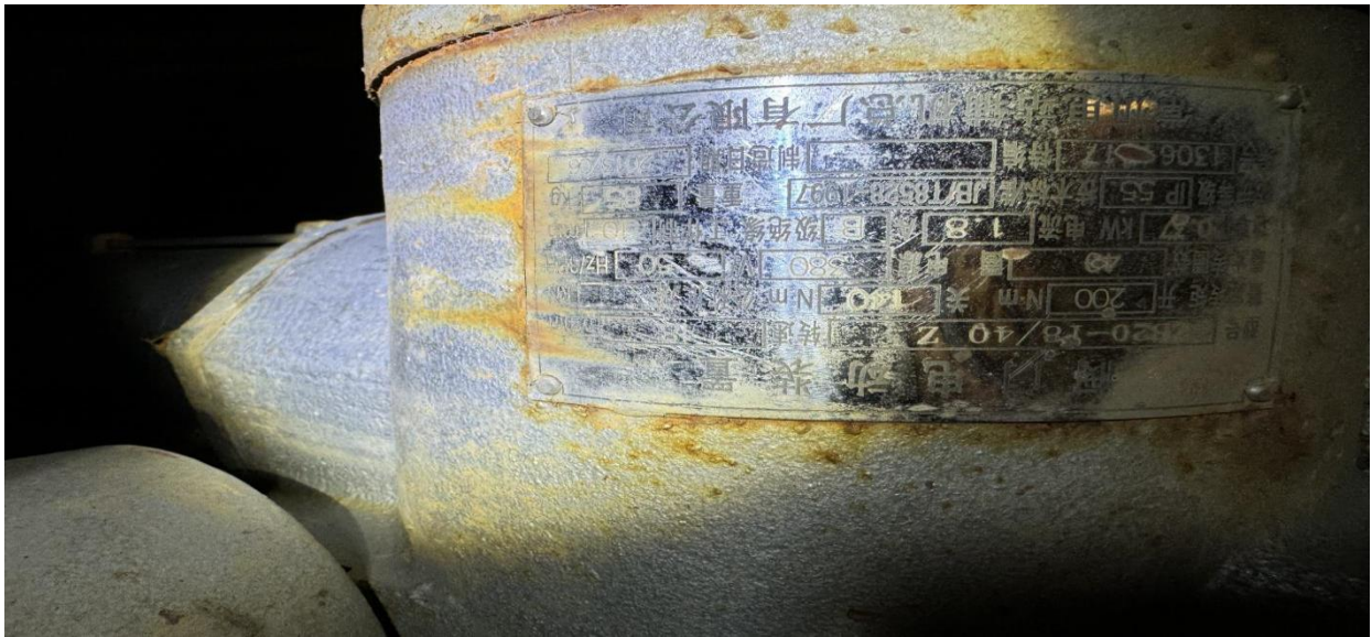
3.疏水泵 A.B 出口电动门 ZB10-18/20 Z 2 只