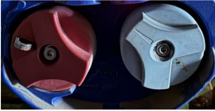
7、操作板 COMU-ILS-FPI&ST 1个