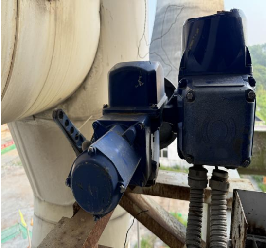
9、混合风调节阀 DKJ-2100DZ 1个