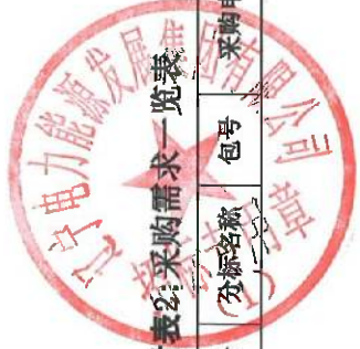
附表2:采购需求一览表