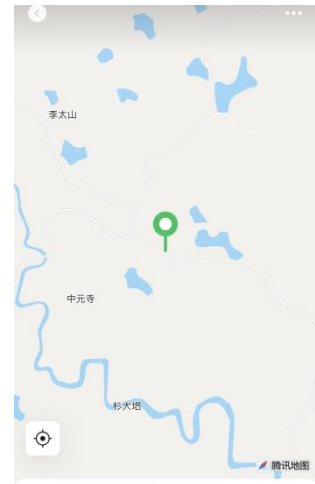
中元寺东北 253 米 四川省宜宾市翠屏区 打车 导航