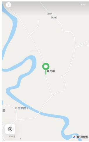
青龙咀 翠屏区 打车 导航

3、交货地点： 中国水利水电第十六工程局有限公司向家坝灌区北总干渠一期第二步工程施工第 I 标段项目施工地点 ，卸车由卖方负责。