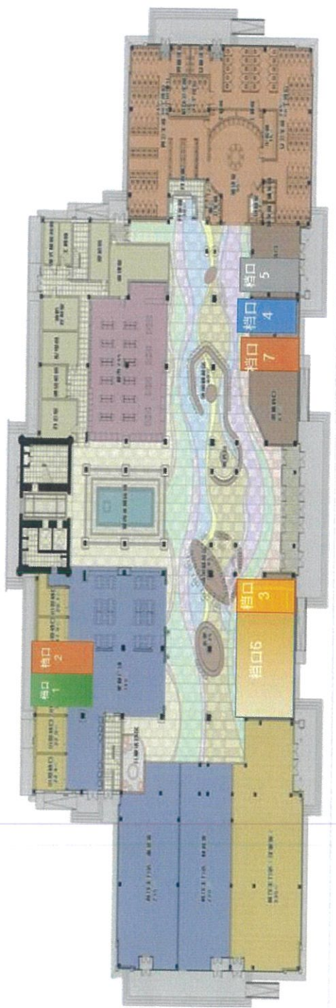
兴城服务区档口点位示意图