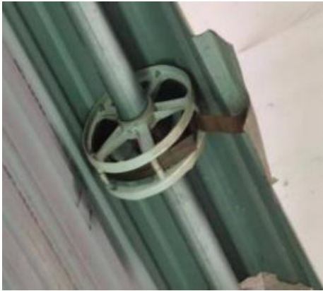
卷帘门拉簧损坏处

危废仓库卷帘门维修：需更换卷帘门拉簧两个。卷帘门宽 3.3 米、高 3.4 米。