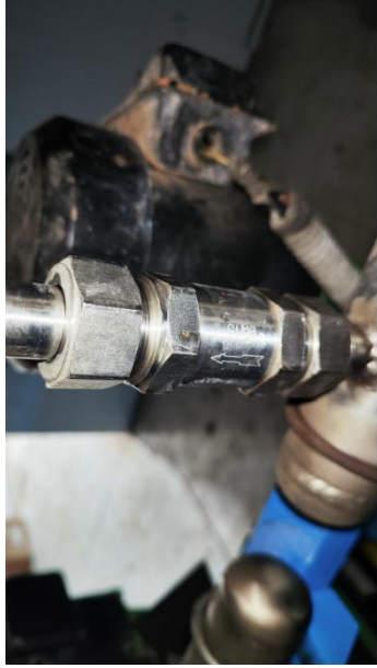
XIACOMI 12S PRO 2024.02.02 10:28:42