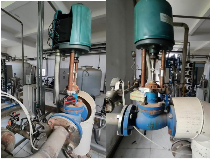
3、生活水池补水电动阀